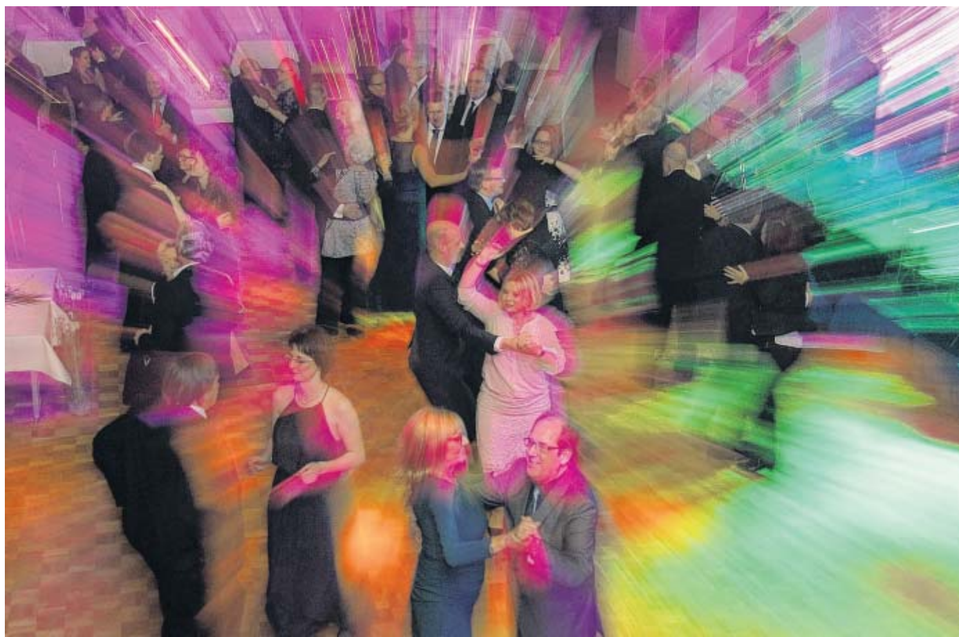
Tanz bis spät in die Nacht: Das Parkett beim Winterball war gut frequentiert.

feder3 via nw.de zum Bericht „Geplanter Lärmschutz löst Skepsis aus“