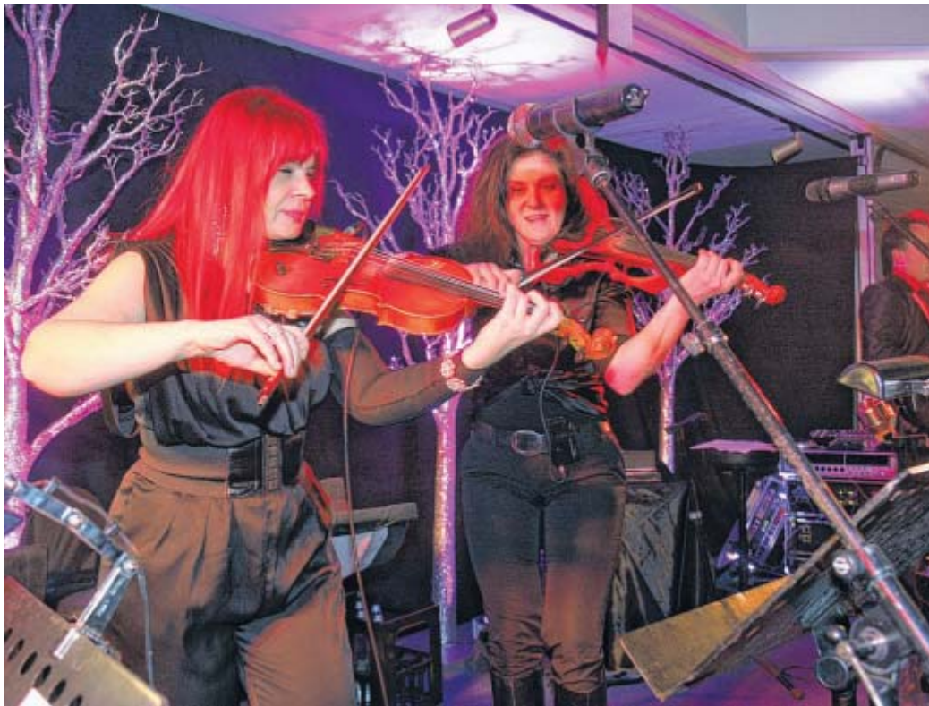
Bewährte Musik im Gepäck: Das smarte Party Symphonie Orchestra (PSO) trat bereits beim Winterball des vergangenen Jahres auf.

Niels begeistert sein Publikum mit einer Mixtur aus Pan-