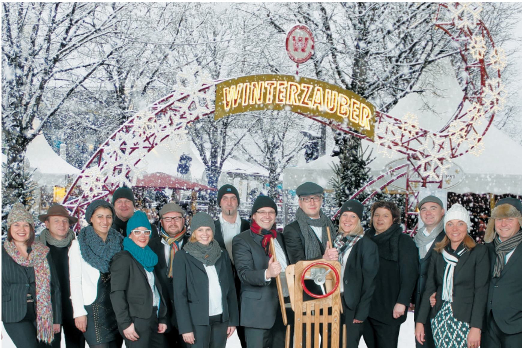
Es kann endlich losgehen: Glaubt man dem Wetterbericht, wird es am Samstag vermutlich draußen nicht ganz so verschneit wie auf diesem Foto. Macht nichts. Für den „Winterzauber“ sorgt am Wochenende schließlich die Schützengesellschaft in der Stadthalle.