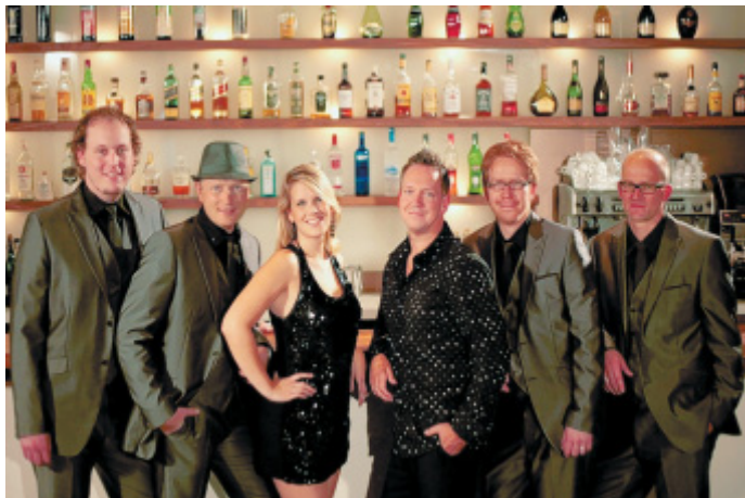
Die Stimmungsmacher: Die „VIP Entertainment Band“ hat vom Walzer bis zum Samba alles tanzbare im Repertoire.

Erstmals präsentiert sich auf der Bühne in diesem Jahr die