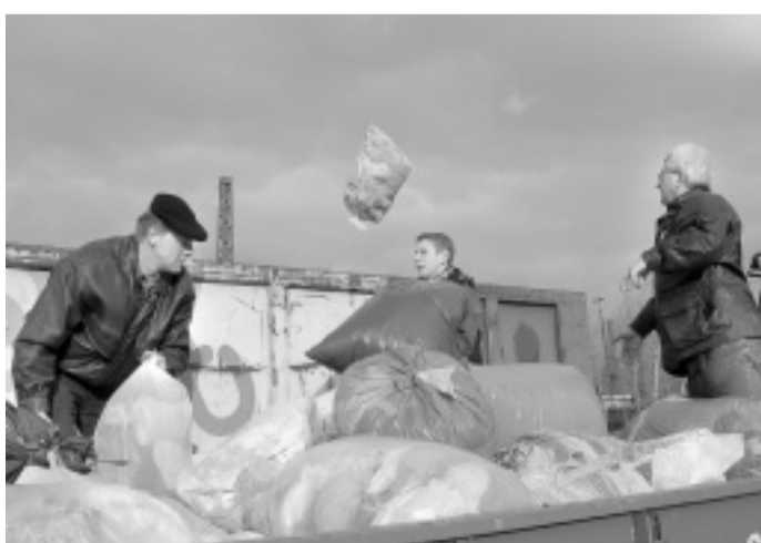
Umladestation Güterbahnhof: Freiwillige Helfer beförderten die Säcke mit den gespendeten Altkleidern in Container. Die Bahn konnte diesmal keine Waggons liefern. Ein Folge des schweren Sturms am Donnerstagabend.

Später weerden die Sachen dann sortiert. Die besonders gut erhaltenen Kleidungsstücke sollen in Second-Hand-Läden zum Verkauf angeboten werden. Mit den Erlösen der nach Gewicht bezahlten Kleidung, finanziert das Kolpingwerk Hilfsprojekte in der Dritten Welt und Mexiko.