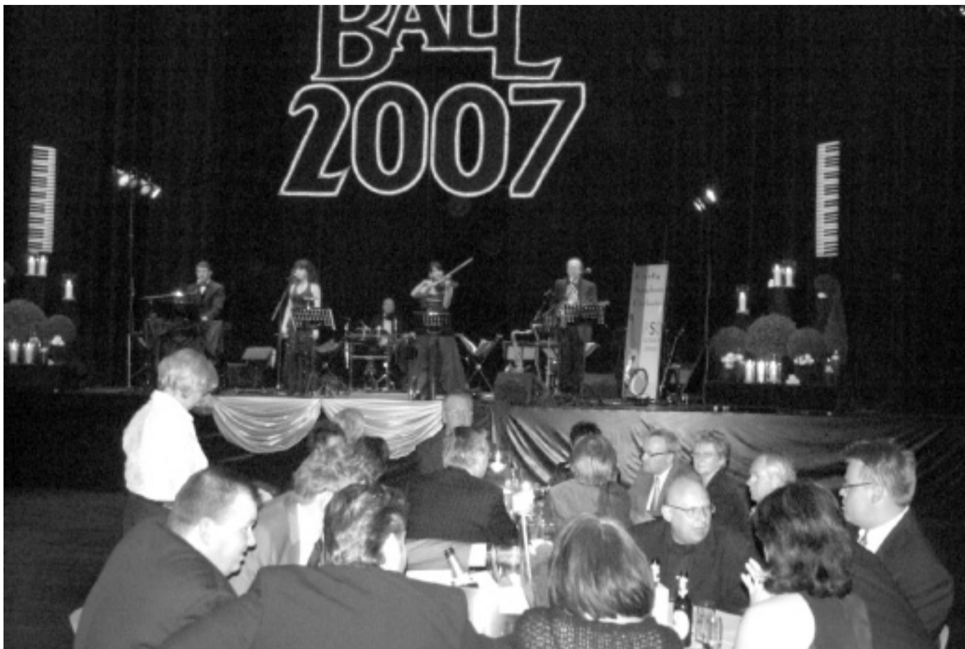
Gute Unterhaltung: Das Party-Symphonie-Orchestra sorgte im großen Saal der Stadthalle für beschwingte Atmosphäre.

6. Meisterkonzert, mit dem SWR-Sinfonieorchester, 20.00, 19.15 Einführung mit Thomas Sander, Stadthalle, Friedrichstr. 10.